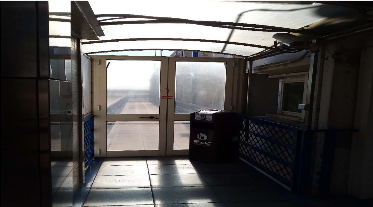
Fig.01: Veduta Area esterna Uffici Amministrativi in cui ubicare la Pompa di calore