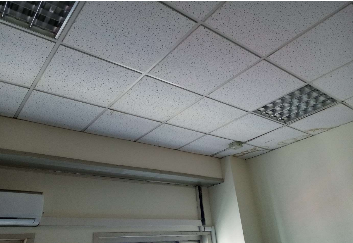
Fig.02: Porzione di controsoffitto del locale Ufficio Protocollo in cui occorre posizionare Recuperatore e sostituire infisso.