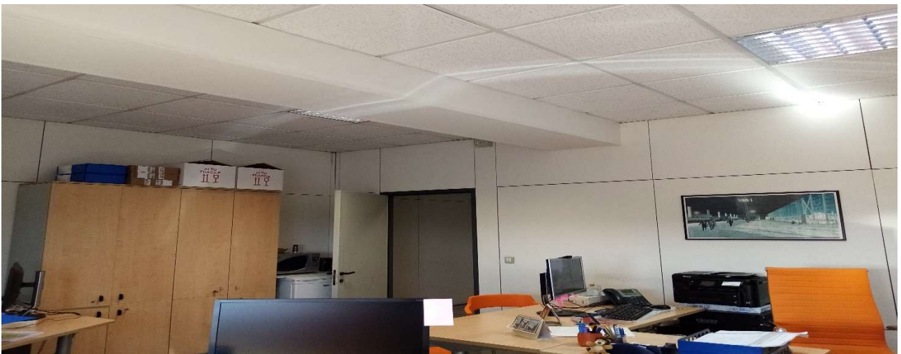
Fig.10 : Infisso Porta su cui posizionare recuperatore di calore per collegamento area esterna